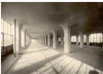
Planta libre antes de la intervención

Nuestro estudio proyectó el Masterplan para la Fábrica de Diseño Van Nelle. También estuvimos a cargo de la supervisión general de las obras realizadas por los otros equipos de diseño y consultoría implicados. Nuestro punto de partida fue ver a la Fábrica de Diseño Van Nelle no solamente como un espacio rentable sino fundamentalmente como un conjunto global de actividades con su propio carácter y en continuo y dinámico cambio, e invitar al diálogo entre lo viejo y lo nuevo. Se definió un equilibrio entre los valores históricos, las futuras funciones y las (relativamente) sustentables soluciones en términos de consumo energético, luz natural, etc. Con respecto al conjunto de edificios, elegimos restaurar la transparencia del partido original, restableciendo la implantación independiente de los edificios en el paisaje y las visuales. La calle interior tendrá poco tránsito, con estacionamientos sólo en el sector posterior de las fábricas. En términos funcionales, la mayor inversión se volcó a mejorar la accesibilidad al área.