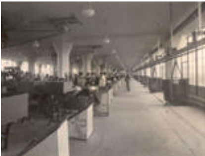
Una de las plantas de procesamiento (imagen de archivo)

Estas aspiraciones sociales coincidieron plenamente tanto con las consideraciones comerciales del cliente –Taylorismo y eficiencia– como con su inspiración espiritual, la Teosofía, para la cual la luz del día adquiere un particular significado.