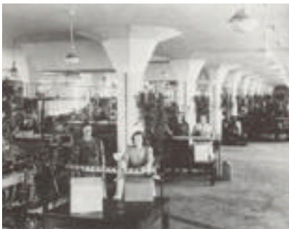
Sala de embalaje (imagen de archivo)

La idea era crear un ambiente de trabajo moderno y transparente, rodeado de verde, inspirado en el modelo americano de "daylight factory" (fábrica con luz natural). El partido en planta se organizó a lo largo de una calle interior. Hacia el oeste se ubicó un largo volumen rectangular subdividido en tres sectores de producción: tabaco, café y té; en el extremo sur de la planta, un edificio curvo para las oficinas; enfrente, entre la calle interior y el canal se dispuso una tira de depósitos, edificios de despacho, edificio de la caldera y departamento mecánico. Cintas transportadoras deslizándose dentro de galerías vidriadas cruzarían la calle interior para conectar los diversos edificios. Espacio de depósito adicional podría ser construido posteriormente hacia el este, en tanto la planta podría extenderse hacia el oeste. En su momento, una cancha de fútbol y otras instalaciones deportivas se ubicaron detrás de la fábrica.