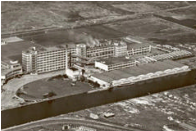
Vista del conjunto