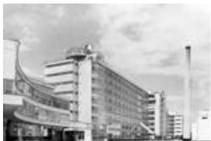
Dibujo del conjunto según el proyecto original de Van der Vlugt

Las fábricas Van Nelle reflejan la convergencia de nuevas ideas de varios campos diferentes. La génesis de la primera etapa de la nueva planta, la fábrica de tabaco, muestra una aplicación radical de algunas de las concepciones culturales y tecnológicas de principios del siglo XX, haciéndose así conocida como una de las más consistentes realizaciones de la nueva arquitectura funcional.