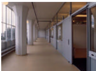
Planta destinada a espacios de oficina

Un importante punto de partida para los edificios de las fábricas fue trasladar las áreas de servicio para los arrendatarios, cafetería, mostrador de recepción y un restaurante, de la planta baja al antiguo Departamento de Tostado, en el segundo piso de la Fábrica de Café.